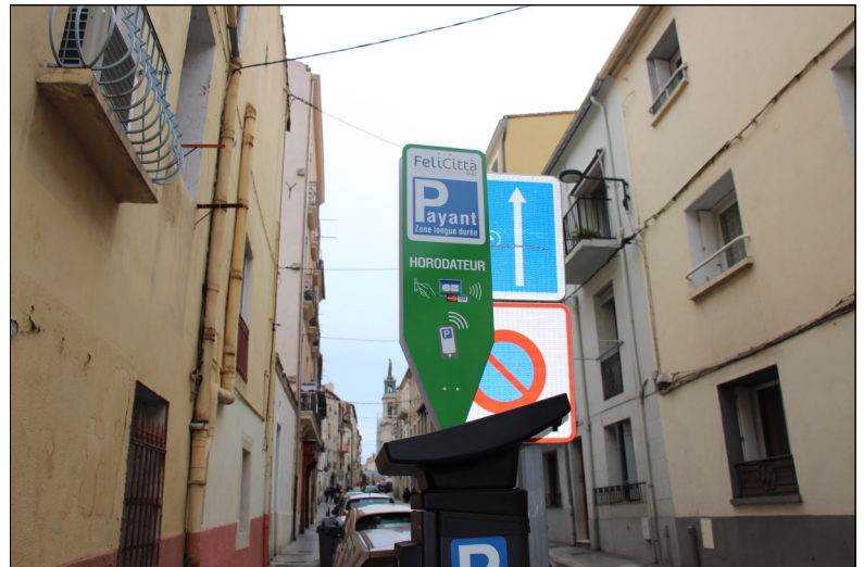
Rue Pascal signalisation peu lisible.