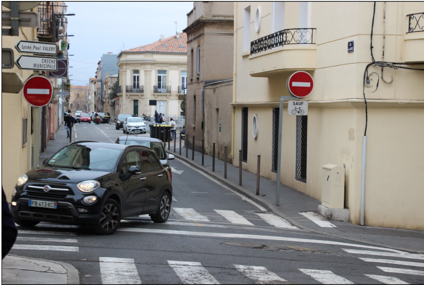
Rue Jean Jaurès double sens annoncé sans marquage au sol jusqu'à l'entrée du parking des Halles