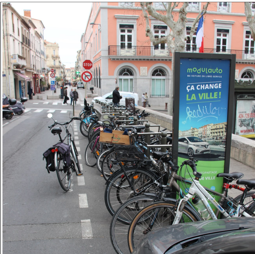
Place Léon Blum arceaux saturés et encombrés de vélos abandonnés.